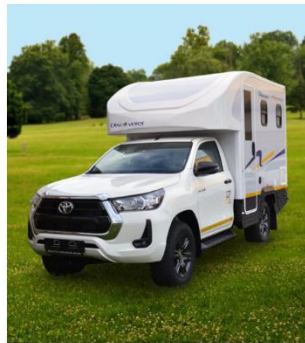
Discoverer FunXA 4x4