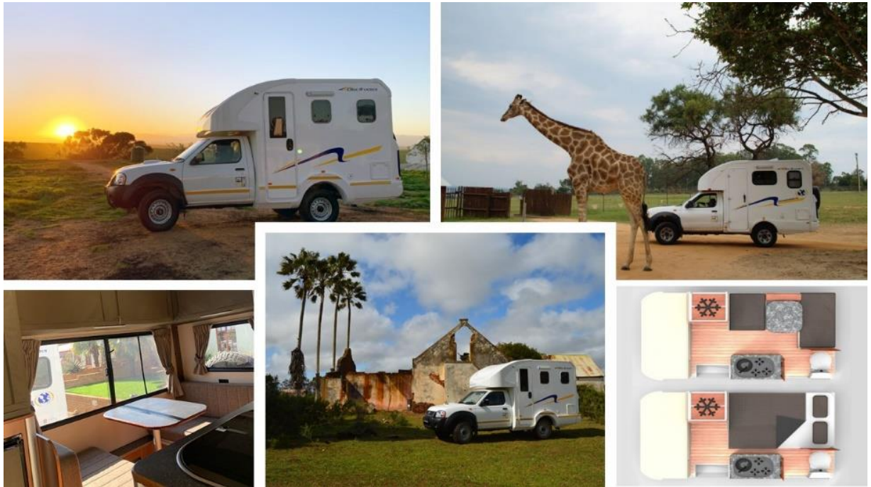
Discoverer FunX Budget 4x4